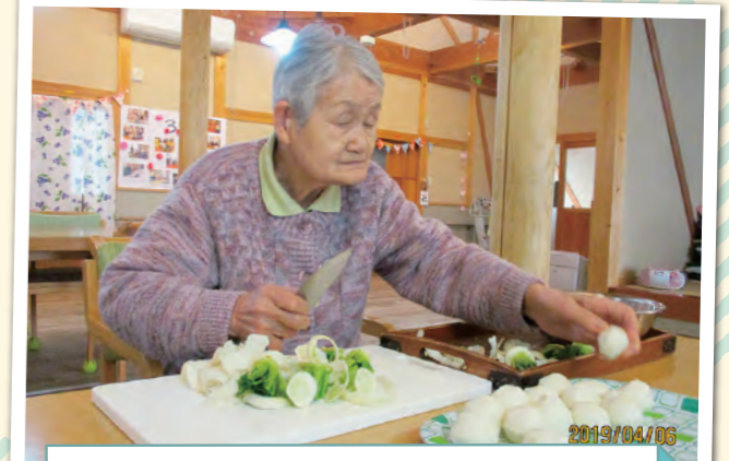
役割支援その二 昼食作り