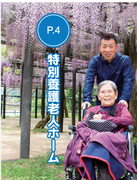
特別養護老人ホーム