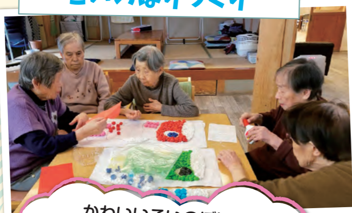
こいのぼりづくり

かわいいこいのぼりが 出来ました♪手先を動かすのは 脳の活性化にとっても良いみたいです♪