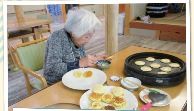
役割支援その四 おやつ作り