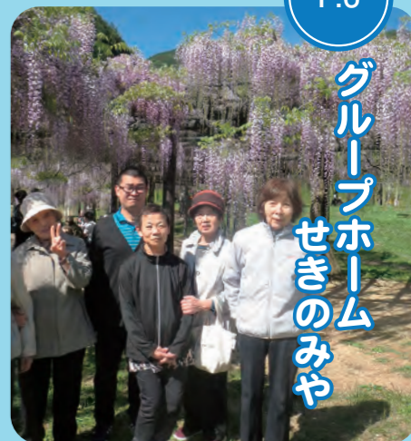
グループホーム せきのみや