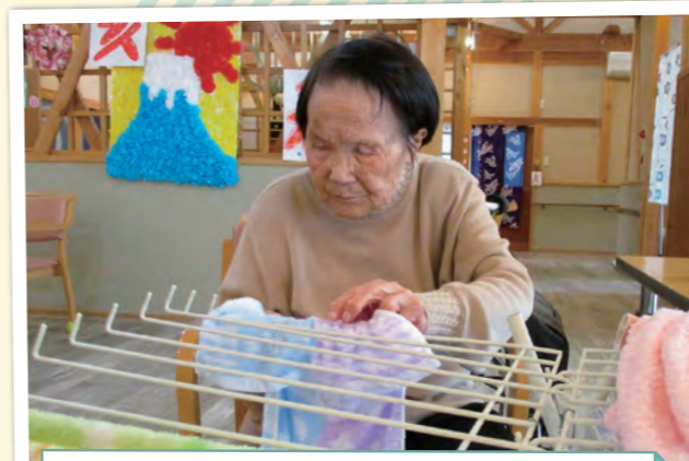
役割支援その一 洗濯

入居者の方、職員、ボランティアさんと一緒になり色々な取り組みをしています。いつまでも誰かのために動く事が大切だと言えます。