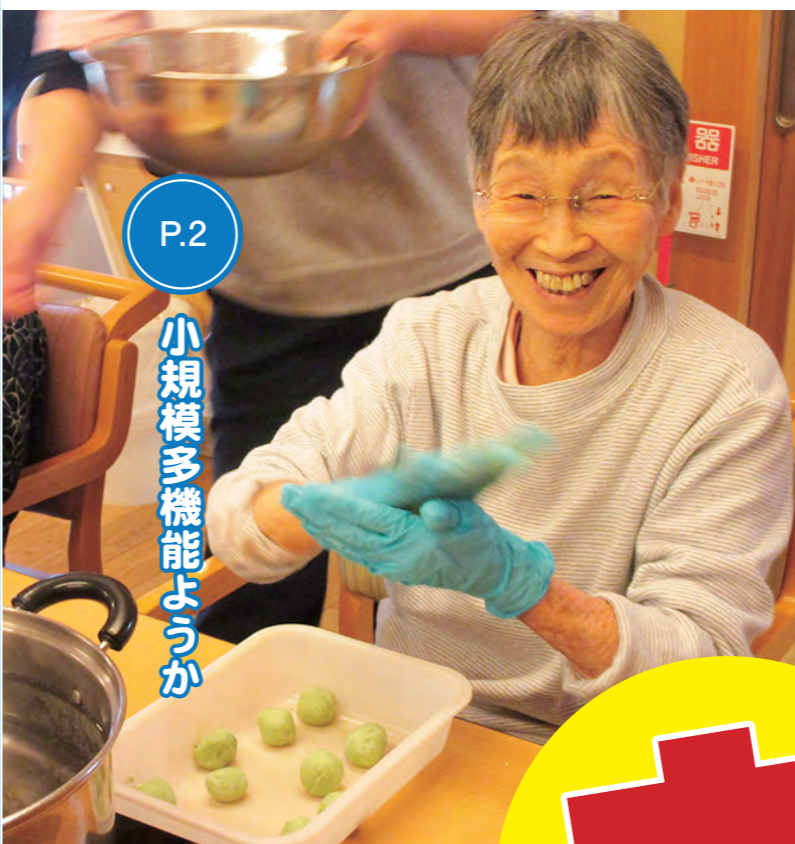
小規模多機能ようか