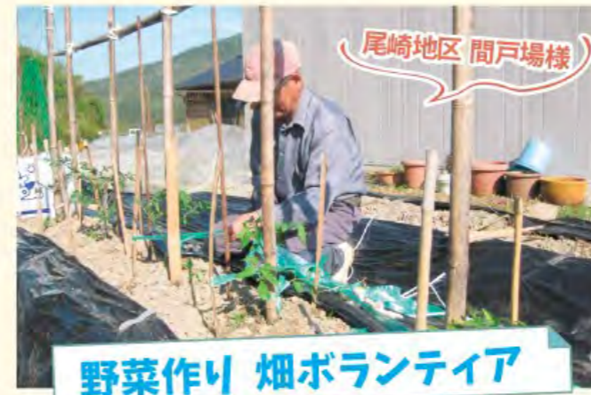
尾崎地区 間戸場様