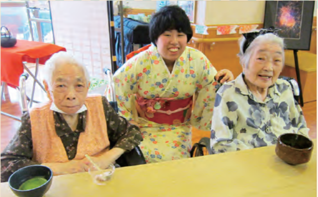
お茶会で着物のお姉さんと♪