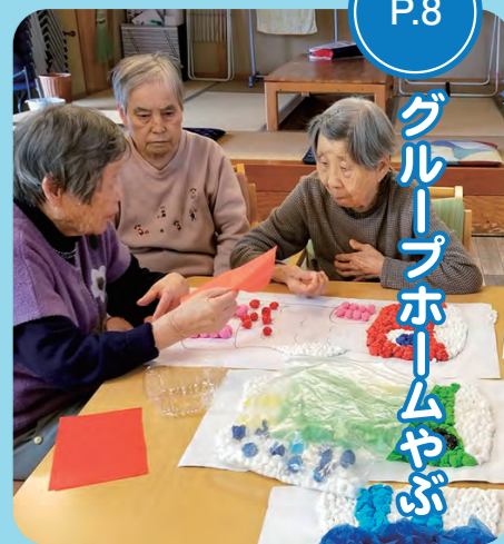
グループホームやぶ