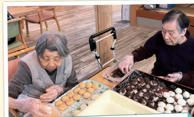
役割支援その三 おはぎ作り