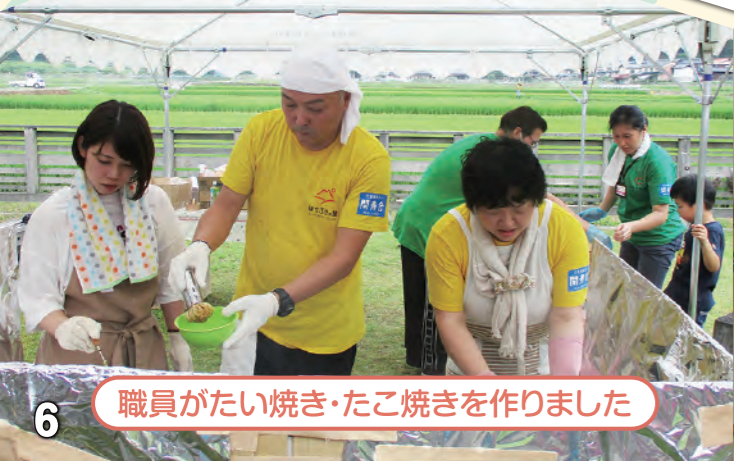
職員がたい焼き・たこ焼きを作りました