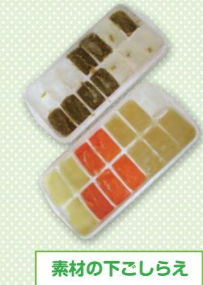
素材の下こしらえ

出来あがった食事をミキサーにかけて提供します。少量の加工でも見た目よく、美味しく、身体状況に合わせて食べやすくアレンジして提供しています。