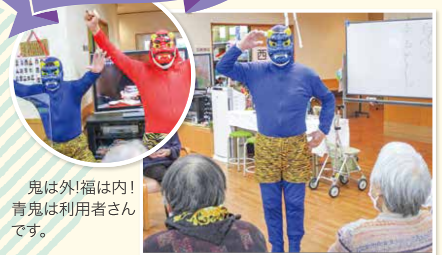
鬼は外!福は内! 青鬼は利用者さんです。