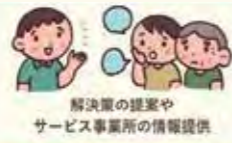
解決策の提案やサービス事業所の情報提供

日々の暮らしの不安や、困りごとの相談に応じます。困りごとや要望を聞かせて頂き、解決の方法を一緒に考えさせて頂きます。