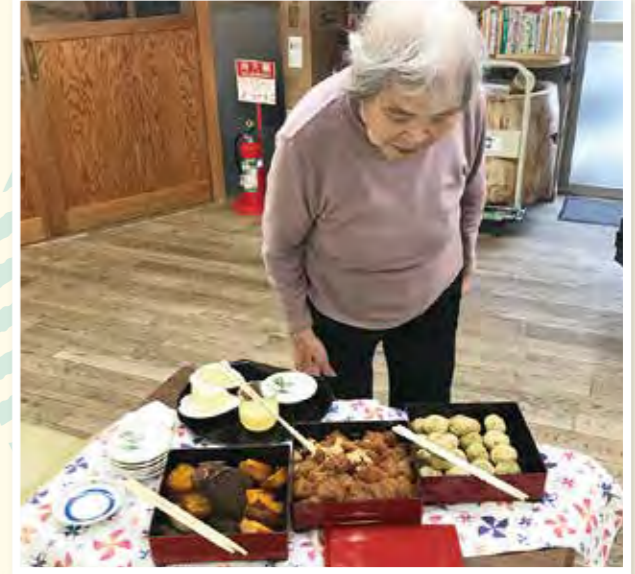
どれも美味しそうですね。