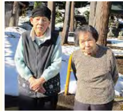
軽部神社にお参りに 行きました。