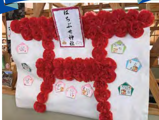
パワースポットが出来ました!