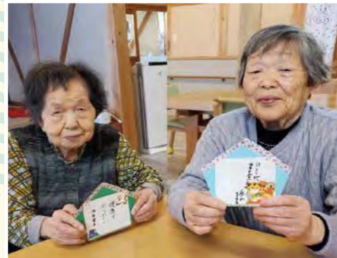
神様に願い事を書きました。