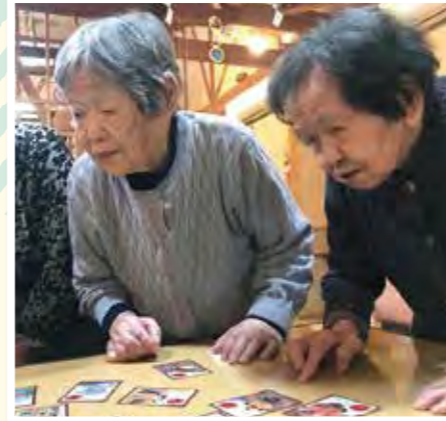
勝負事は皆さん真剣です!