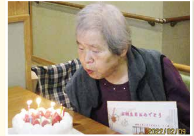
毎月恒例のお誕生日会です。 ろうそくの火をふーっと消しましょう。