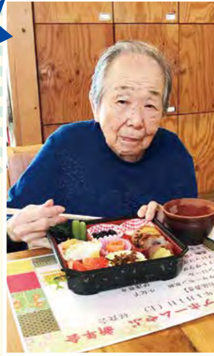
たくさん召し上がってください。