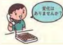
変化はありますか?

困り事が解決に向かう為にサービス事業所への情報提供や、サービスが適正に行われているか、困りごとが解決に向かっているか、事業所と連絡調整を行います。