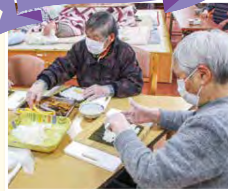
昼食は巻きずしを作りました。