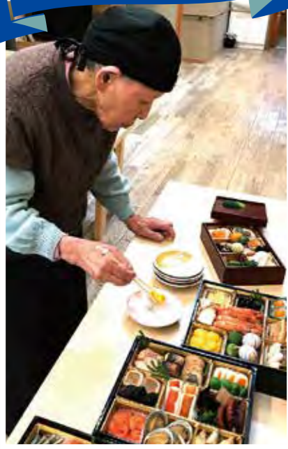
好きなの選んでくださいね!