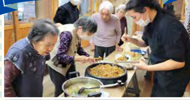
たくさんありますねー!