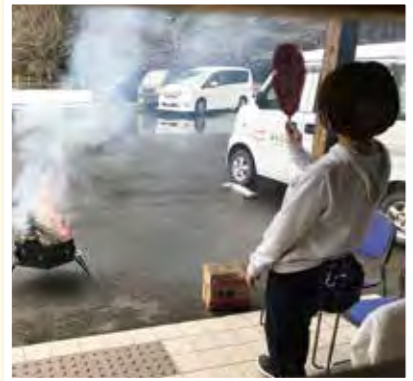
どんどの煙にあたって 無病息災を願いましょう。