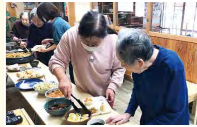
こっちもいいですねー!