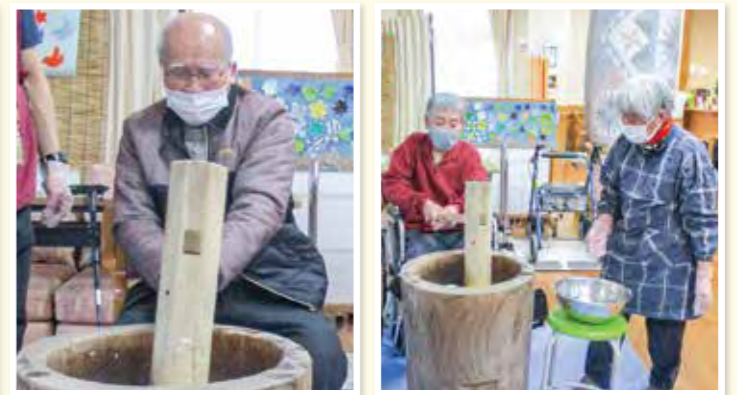
美味しいお餅が出来ました!