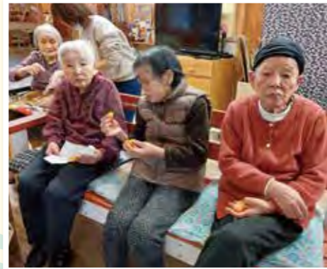
どんどの火で焼きミカンを いただきました。