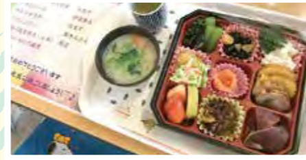
今年も良い年でありますように。