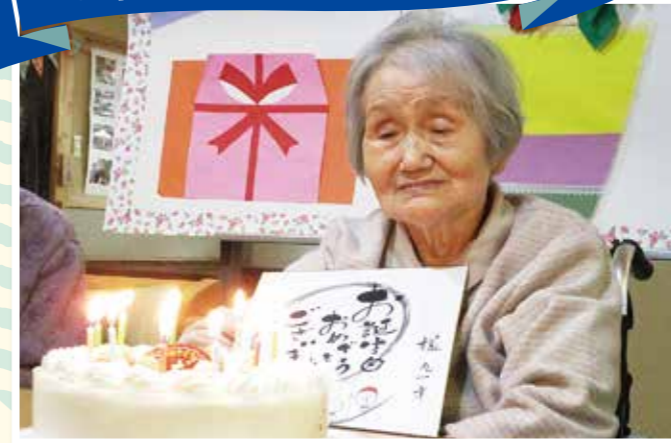
ハッピーバースデー! おめでとうございます!!