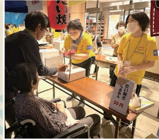
沢山のご来場者で大いに盛り上がりました。