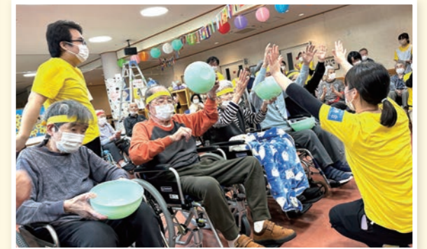
勝ちました。バンザイ!