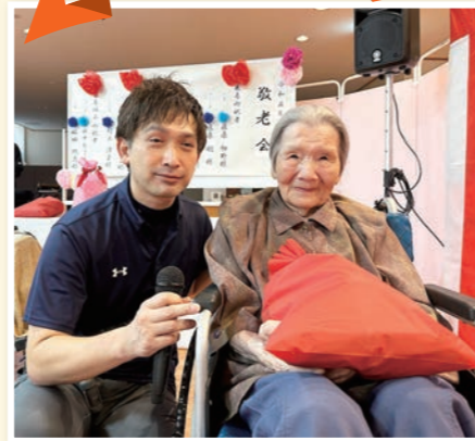
まだまだ元気です。元気さは誰にも負けません。