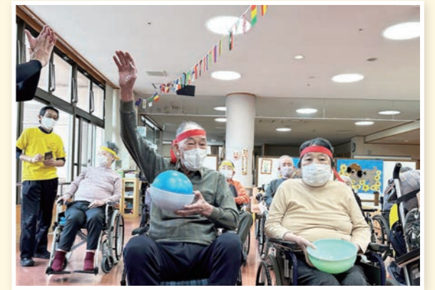
ボール渡して1番早くゴールです。やったー!