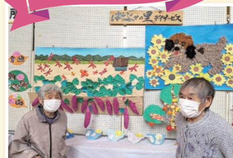
「あ!これ、私の作ったやつだ!」 なかなかの出来栄です。