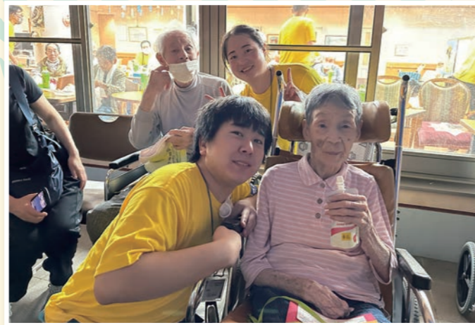
馴染みの職員と記念にパシャリ!久しぶりの笑顔です。