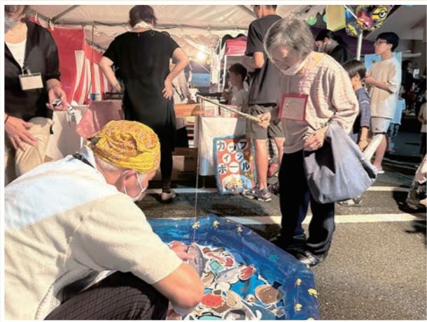
魚釣りゲーム!いっぱい釣れて沢山の景品をゲット!